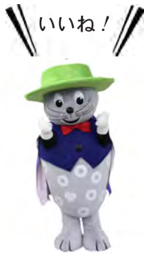
えりも町キャラクター ウインディーくん

5月14日の「わらしやんど・えりもまるごと自然体験」に参加した小学生たちは、北緯42度の会のメンバーと野山を歩き、ウドやタラの芽などの山菜を収穫。郷土資料館に戻り天ぷらを揚げ、美味しそうに食べていました。