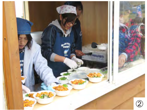
①ウニ購入整理券を求め長い行列②漁協女性部がつくるミニウニ丼 ③食事を楽しむ来場者④初出店したなかの牧場。今回の高校生かふえに メンチカツサンドを無料提供⑤漁協冬島青年部の焼き白貝⑥東洋漁協 青年部のカニ鍋⑦E-Heartsのダンスパフォーマンス⑧祭本舗風 舞はジュースやたこ焼きを販売⑨1年生9人が新加入した風極プロ ジェクト同好会の「高校生かふえ」は、メンチカツサンド200食を完売した