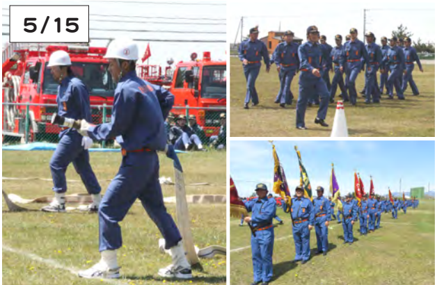
すばやい動作で放水の体勢へ。小型ポンプ操法訓練(左)