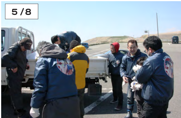
集めたごみをトラックに積み込む観光協会の会員