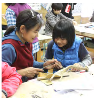
お母さんと何をつくっているのかな...