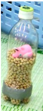
図1-ガラガラおもちゃの作り方

マミイ教室は、生後2歳までのお子さんを持つママも参加できます。どなたでも、簡単に作れるおもちゃとなつていきますので、お子さんと一緒におもちゃ作りをする機会として、ぜひ参加してみてください。