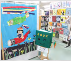
図書室マスコットキャラクター BOOK(ブック)くん

〒福社センター図書室 ☎2526 E-Mail : erimolib@seagreen.ocn.ne.jp