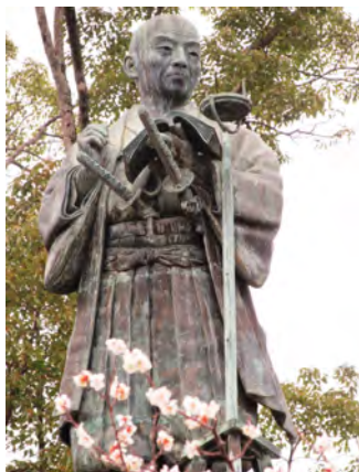
写真・伊能忠敬立像(千葉県香取市佐原)

「三治郎」でした。数え歳の7才の時、母を亡くし、10才の時、父の実家「神保家」に引き取られ育ちました。宝暦12年(1762)、17歳にして佐原村(現在香取市佐原)の伊能家の婿養子となり、名を「忠敬」に改めました。 伊能家は、大地主であり、酒造り、米の売買、川船での運送業などを営んでいました。