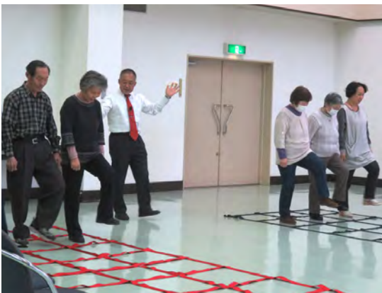
2月22日「ふまねっと講演会&体験会」

この運動は、すでに多くの市町村で実施されておりますが、当町においても高齢者の方の健康寿命の延伸に繋がる有効なものと考えておりますので、その普及についてサポートの養成等も含めながら、取り組みを進めてまいります。