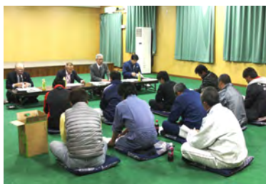
昨年度の議会報告会「議員と語る会」の様子

町内の各地区を町議会議員が訪問し、議会の内容や活動等を報告する議会報告会「議員と語る会」を下記の日程で開催します。 実施内容は、「平成29年度えりも町各会計予算について」及び「町民との意見交換」です。 町民みなさまのご参加をお待ちしております。 ▽開催時間 いずれの会場も午後6時30分から2時間程度