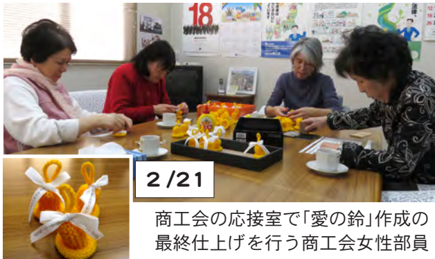
2/21 商工会の応接室で「愛の鈴」作成の最終仕上げを行う商工会女性部員