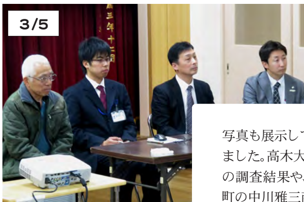
講師を務めた左から北村会長、高木隊員、中川係長、岩井課長