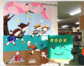
図書室マスコットキャラクター BOOK(ブック)くん