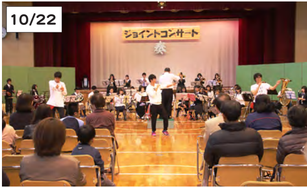
プログラム最後の演奏で、恋ダンスのパフォーマンスを披露する中学生の3人