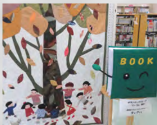
図書室マスコットキャラクター BOOK(ブック)くん