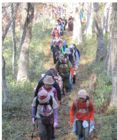
写真・今年の猿留山道を歩く会の様子

小さな湾の形をしており、船溜があり、七八石の船（長さ5 m弱）が停泊できる。会所と通行家は浜辺から奥へ220 m位にあり、南西に向いている。庭前の左に稲荷の祠があり、建物の後ろに住吉弁天の祠があり、住吉の祠は蝦夷地では珍しい。