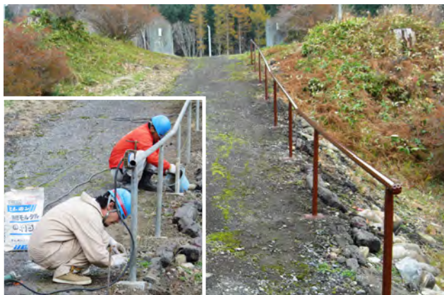
手すり設置作業（左）手すり設置後（右）