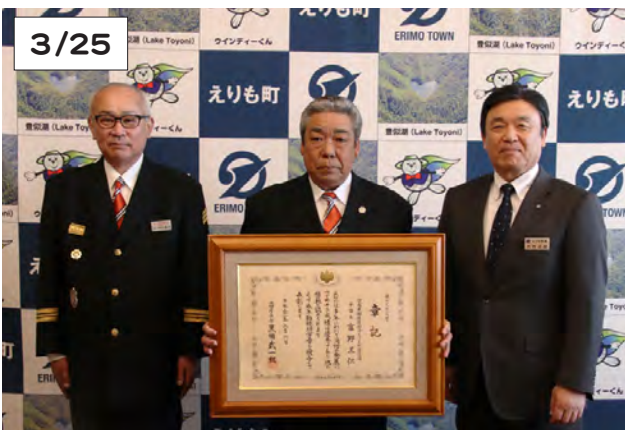
大西町長(右)から伝達を受けた富野さん(中央)