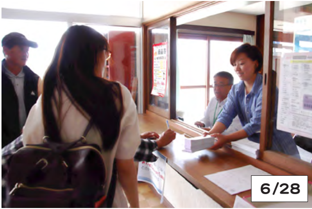
プレミアム付商品券販売中の庶野生活館会場