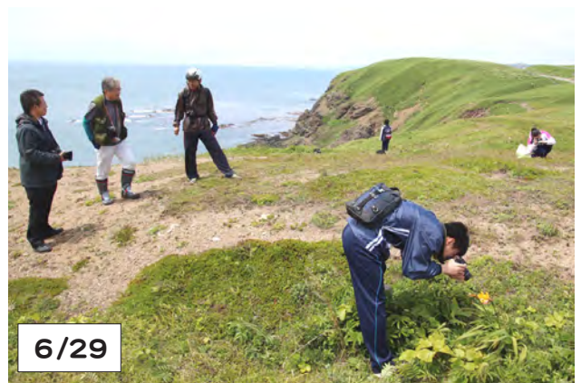
襟裳岬駐車場横の遊歩道付近で花を撮影する高校生

えりも高では、町内や浦河町・様似町の各機関や事業所の協力を得て、1・2年生の生徒が数名のグループで放課後や休日を利用して探究活動を行う「地域探求型学習」を今年から始めました。この日は生徒3人が、えりも観光大使で北海道医療大の堀田清准教授から、襟裳岬駐車場付近に咲いている高山植物などの貴重種を教わり、一眼レフカメラを使って、写真撮影会を行いました。