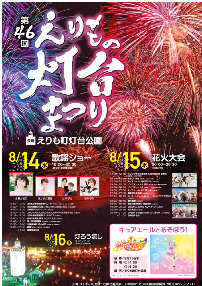
第46回 えりもの灯台まつりのポスター