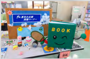
図書室マスコットキャラクター BOOK(ブック)くん