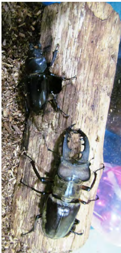
【写真・ミヤマクワガタ】

町内では、町内全域の山林で見られ、夜間に商店や外灯などの明かりに飛んでくることがあります。