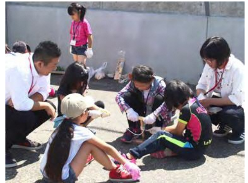
スキルアップスクール「非常時の食事づくり体験」

8月17日、18日の2日間、小学生を対象とした学習サポートを市街地青少年育成協会と共催し開催しました。庶野小・えりも小の児童15人が参加し、えりも高校卒業生を含む大学生3人が指導に当たり、基礎学力の定着をめざし学びの時間を過ごしました。また、防災学習として、日高東部消防組合えりも支署の協力を得て、救急救命訓練や火災時の煙体験、非常時の食事づくりを体験しました。