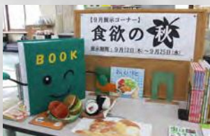
図書室マスコットキャラクター BOOK(ブック)くん