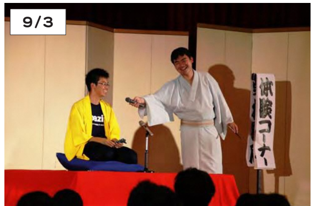
落語家に与えられたお題で落語体験をする中学生