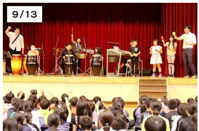
打楽器演奏体験で盛り上がり、会場が一体に