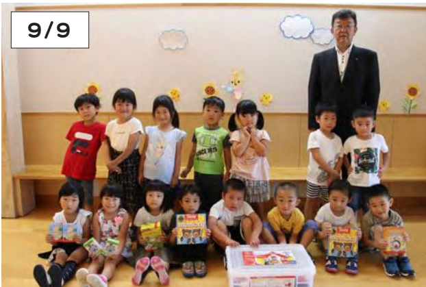
贈られたおもちゃと記念撮影する園児と小田支店長