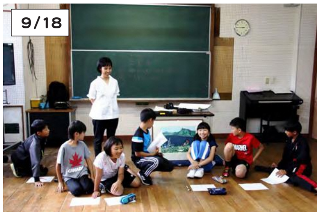
松山学芸員から美術作品について教わる児童