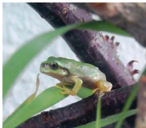
【写真・ニホンアマガエル】

ニホンアマガエルは、根室半島を除く北海道全域に分布しています。体長は20mm～45mmほどで、背面は黄緑色ですが、周囲の色により茶色、黄色、灰色などに変化することがあります。丸く膨らんだ指先には吸盤があり、植物の茎やガラス面などを上ることができません。指の間には水かきもあります。夜間によく動き、小型の昆虫やクモなどを捕食します。繁殖期は4月末から8月と長期間続きます。1匹のメスは250～800個の卵を数個ずつ、まとめて何回も産みます。孵化したオタマジャクシは9月末頃までに、カエルになります。(孵化後30日～45日程度) 10月頃からは落ち葉等の下などの温度が安定した場所で冬眠します。