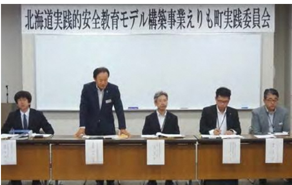
第1回北海道実践的安全教育モデル構築事業えりも町実践委員会

また、10月には、東日本大震災で大きな被害を受けた被災地への視察も計画しています。