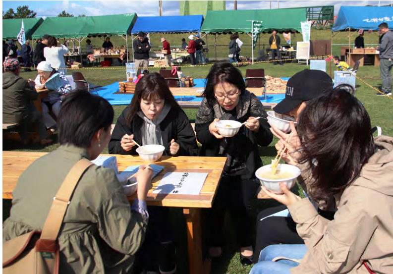
えりも漁協女性部から無料提供されたサケ鍋を味わう来場者