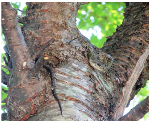
【写真・アオダイショウ】

日中に活動し、木に登ることを好みます。水に入ることもあり、泳いで移動したりと、行動範囲は三次元的で広く、ネズミや小鳥、鳥の卵などを捕食します。冬には土や石の隙間、倒木の下などで冬眠します。