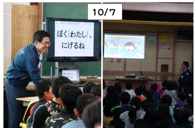
気象台職員が庶野小(左)と庶野保育所(右)で津波のお話

庶野小で、一日防災地域学校が行われ、児童と地域住民も参加し、防災に対する意識を高めました。庶野小では、室蘭気象台の職員が講師となり、東日本大震災の映像から、地震と津波の備えや行動について学びました。その後、地震発生による津波を想定し、校舎内から高台にある庶野保育所まで避難訓練。保育所では園児と、避難行動を学ぶDVDを観た後、駐車場で消防車両と給電車を見学しました。