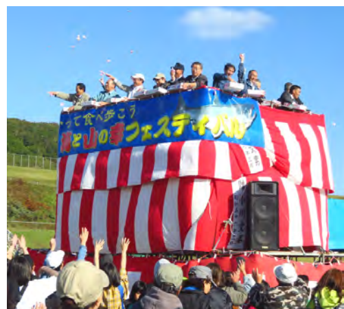
サケも当たるもちまき大会