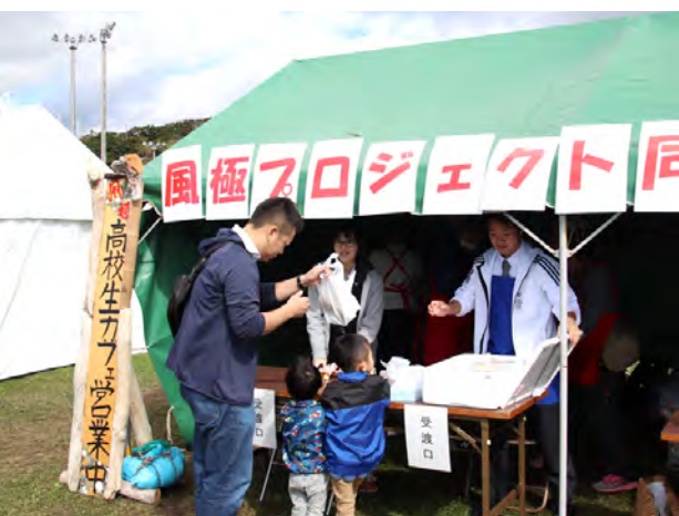
えりも高風極プロジェクト同好会の「高校生カフェ」

えりも漁協女性部はサケ鍋、航空自衛隊襟裳分屯基地はカレーうどんを無料提供し、テント前は行列。そのほか、サケのチャンチャン焼きやイクラ丼、灯台ツブ串や短角牛など、えり