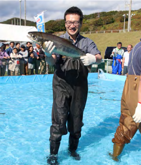
サケをつかまえて笑顔