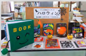
図書室マスコットキャラクター BOOK(ブック)くん