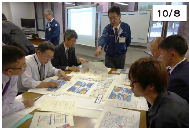
気象台職員の指導を受け、課題をグループで協議