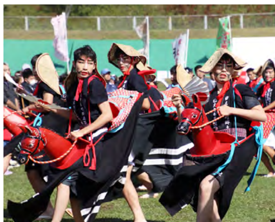
郷土芸能「駒踊り」を披露するえりも高1年生