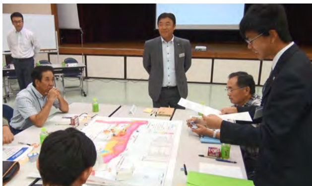
えりも高生が地域探求学習(防災)のレポート発表④ 新浜・あけぼの・柏台の3自治会がグループ討議⑤