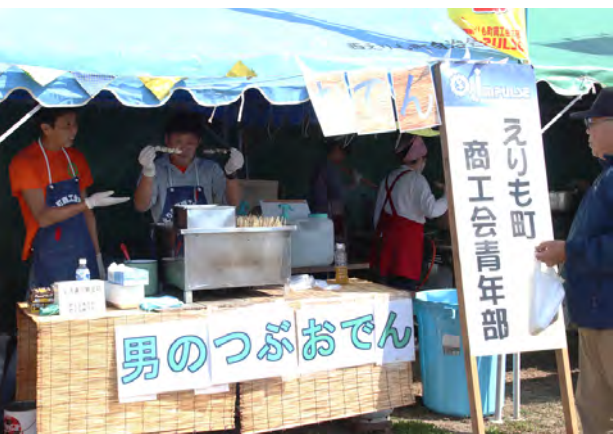
商工会青年部は「男のつぶおでん」を販売

もちまき大会では、当たりシールが付いている袋を拾った人は景品と交換でき、目玉にはサケや豊似湖ヘリコプター遊覧飛行搭乗券がありました。