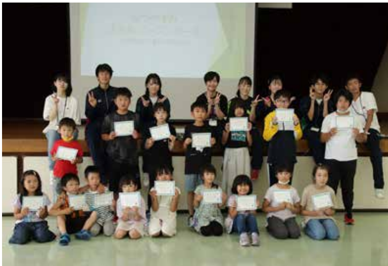
修了証を手に記念撮影

『実験チャレンジ』では、コーラにメントスを入れたり、ハンガーやうちわなどを使ってしゃぼん玉を作ったり、家ではできない実験を楽しみました