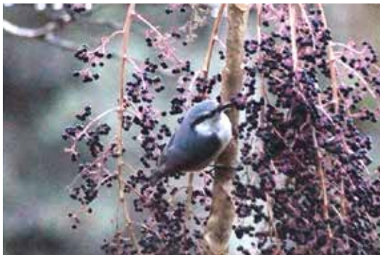
【写真：ゴジユウカラ】

繁殖は、キツツキの巣穴や樹洞(木に開いている穴)、巣箱等を利用します。巣穴のサイズが大きい場合は泥を塗り、適切なサイズにリフォームします。