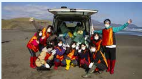
海岸清掃や、コンブポートクルーズを活用した海洋マイクロプラスチック調査体験を実施