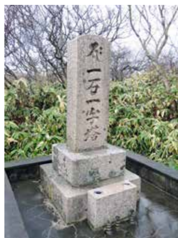
【一石一字塔(庶野地区)】 217年前の江戸時代1806年に建られた、町内で一番古い石碑です。

北海道大学地震火山研究観測センター 地震観測研究分野教授、PhD。 米国ミシガン大学博士課程修了後、気象庁気象研究所研究官、北海道大学助教授を経て2010年4月より現職。 専門は地震学(巨大地震・津波)。