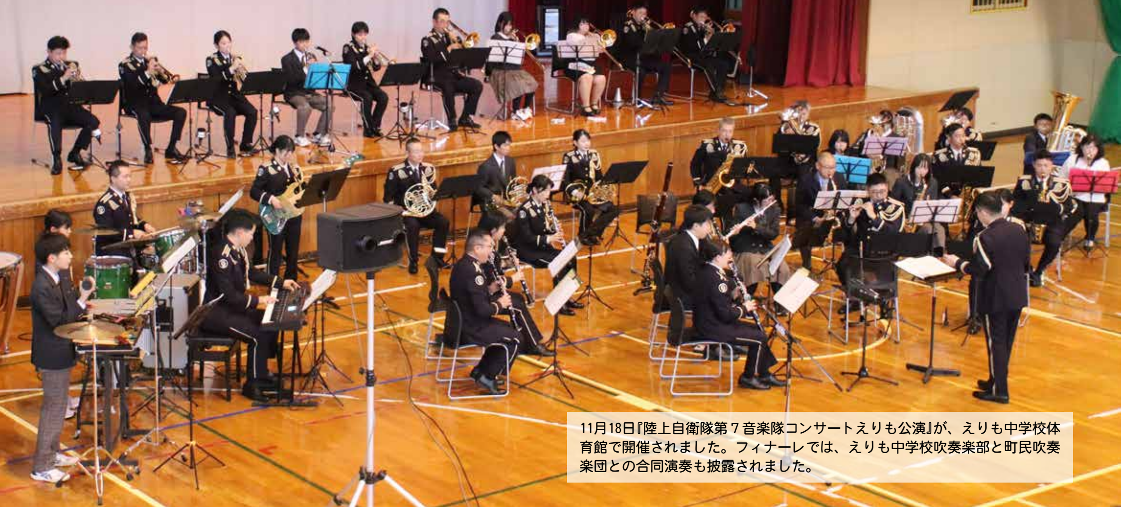
11月18日『陸上自衛隊第7音楽隊コンサートえりも公演』が、えりも中学校体育館で開催されました。フィナーレでは、えりも中学校吹奏楽部と町民吹奏楽団との合同演奏も披露されました。