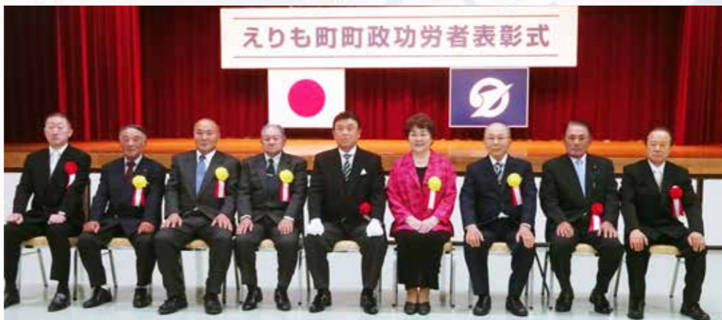
【表彰式には5人が出席】

11月3日、令和5年度町政功労者表彰式が福祉センターで行われました。受賞された7人の功績は次のとおりです。