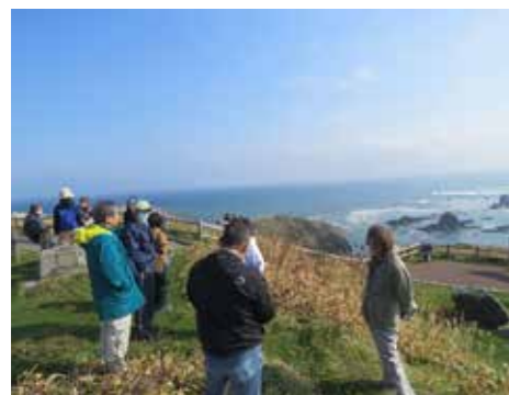
襟裳岬を見学する様子

百人浜の「悲恋沼」という名は、観光ガイドのために作られたアイヌ女性にまつわる創作物語を基にしており、アイヌ語名はシトウ(本当の・沼)であることもわかりました。 アイヌ民族にとって大切な場所である国名勝「ピリカノカ」に指定されている襟裳岬(オンネエールム)では、ポロイソ(大きな・磯)等アイヌ語由来の名称が今でも使われています。 町内にはアイヌ語に由来する地名が数多く残されています。慣れ親しんだ地名でも由来をたどれば、えりも町のアイヌ文化を感じることができます。