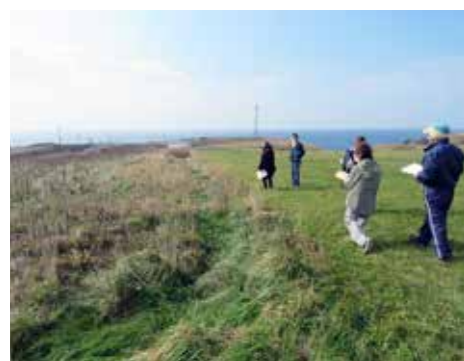
油駒チャシ跡遺跡を歩く参加者

当日はスポーツ公園、クツフル工大明神があった歌別漁港付近、東洋(ユシヨロスケ)、油駒チャシ跡遺跡などをまわりました。また、えりも町のアイヌ文化について話し合い、アイヌ語に由来する地名をたどり、各地に残る伝説を学習したり、参加者同士で思い出話や伝承を語り合いました。