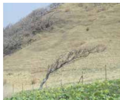
【強風地帯の特徴的な樹形】

えりも町を語るうえで外せないものは「昆布」と「風」です。強風や時化が続いて何日も漁に出られなかったり、かと思えば丁度良い風向き・強さの風が吹くことでコンブがうまく浜に打ちあがりたり、風に苦しめられることもあれば、助けられることもあり。昆布と共に歩んだ暮らしの中で、風にはいろいろな名前が付けられてきました。たとえば「下風(しもかぜ)」は、山をざわめかせながら海の方へ吹き、ひどい時には屋根を飛ばすような強風にもなる危険な風です。真西や南西から吹く風は「ひかた」と呼ばれ、天気が良く見えても急に雨や雪が降ることがあるなど、昆布