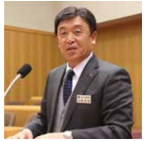
町長 大西 正紀

はじめに、1月1日発生した能登半島地震について、被災されました方々には、お見舞いを申し上げますとともに、一日も早い復旧・復興を心から願っております。また、地理的な条件で、本町と類似する場所での発災であったこともあり、大変心配をしているところでもあります。