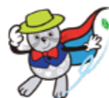
僕の名前の由来も風の名前だよ (表紙を見てね)

えりも町を語るうえで外せないものは「昆布」と「風」です。強風や時化が続いて何日も漁に出られなかったり、かと思えば丁度良い風向き・強さの風が吹くことでコンブがうまく浜に打ちあがりたり、風に苦しめられることもあれば、助けられることもあり。昆布と共に歩んだ暮らしの中で、風にはいろいろな名前が付けられてきました。たとえば「下風(しもかぜ)」は、山をざわめかせながら海の方へ吹き、ひどい時には屋根を飛ばすような強風にもなる危険な風です。真西や南西から吹く風は「ひかた」と呼ばれ、天気が良く見えても急に雨や雪が降ることがあるなど、昆布