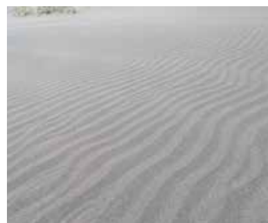
【砂浜にあらわれる風紋】

漁にはむかない風といえます。日高山脈の東西58kmもの長い海岸線を持つ当町では、地区によって、吹くと「嬉しい風」や「困る風」が違うこと、また、同じ風向きでも名前が違うなどの様々な事情があるため、風のことをより詳しく知るためには、できるだけ多くの方からの情報が必要です。そこで本事業では、漁師さんなど町の皆様に、風の名前や吹き方など「うちの浜の風事情」を教えてくださいたいと考えています。ぜひ郷土資料館(☎212410)までお電話いただくか、直接ご来館ください。風極の町えりも町の「風の地図」を一緒に作りましょう。