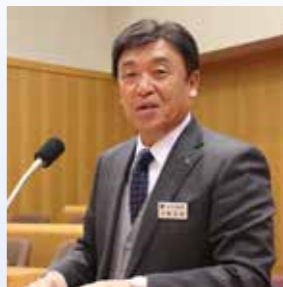
町長 大西 正紀

私が2期目の町政を担わせていただいた4年の間には、世界的な新型コロナウイルス感染症の大流行により、日常生活が大きく制限を受ける中で、予定していた行事の中止や延期を余儀なくされたと同時に、感染拡大防止対策などに多くの時間を割く結果となったわけですが、日高山脈襟裳国定公園の国立公園化はもとより、漁業・農業への新規就業や事業継承に対する支援、赤潮により大きな被害を受けた生産者への助成、教育の分野では庶野小学校の