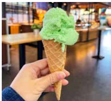
ヴァルトマイスターのジェラート (ドイツ・フライブルク)

クルマバソウはドイツ語でヴァルトマイスター (Waldmeister/森の名人) といい、現地ではワインやジュース、ゼリー、ジェラートなどの香り付けとしてよく使用されます。