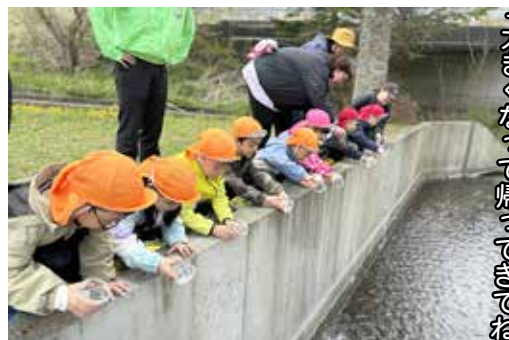
「大きくなった帰って来たね」