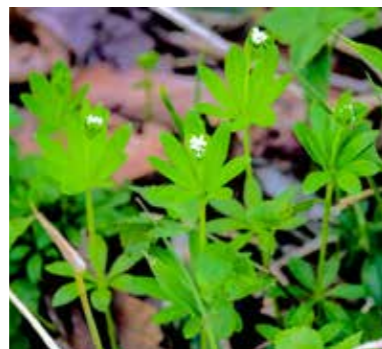
つぼみがついたクルマバソウ

手軽な楽しみ方として、クルマバソウシロップを炭酸水で割ったサイダーや、かき氷にかけるのもおすすめです。ぜひ試してみてください。