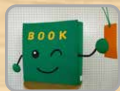
図書室マスコットキャラクター BOOK (ブック) くん