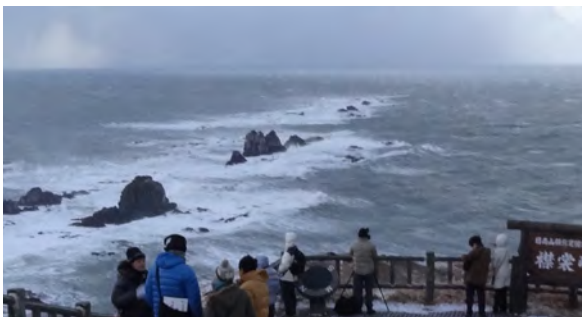
水平線にも厚い雲

ら話して もらった 二十歳の 抱負のビ デオ上映 や餅つき が行われ、さら に北緯四 十二度の