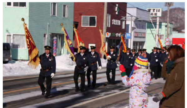
頼もしい姿を見せた消防団員

団員百三十人が出席し、本町市街地を一周りする市中分列行進では、寒風も何のその。頼もしく勇壮な姿をみせました。福祉センターの式典では、延べ五十三人の団員が勤続表彰受けました。