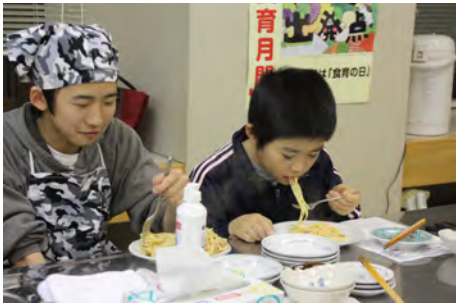
美味しいと満足の参加者