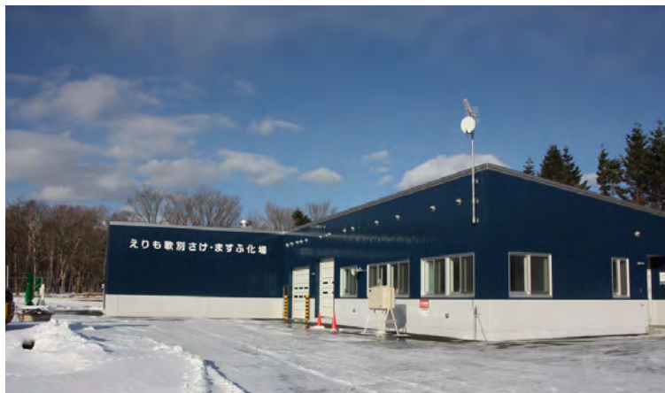
改築した「えりも歌別さけ・ますふ化場」

これまでの「立体式ふ化器」では、職員がサケの死卵や不良卵を一つ一つ取り除く作業が必要で、生育状況によっては正月返上で作業に当たることがありました。浮上槽では、ふ