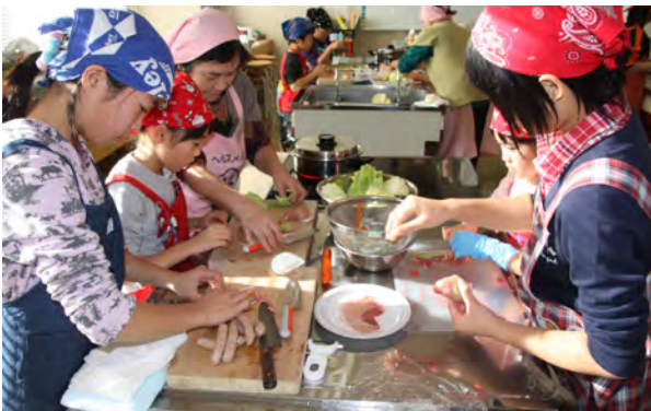
料理教室には32人が参加しました。

料理教室は、保健福祉課の保健事業の一つとして毎年この時期に開催しており、今回は三十二人の子どもたちが参加しました。「野菜を食べよう」をテーマに行われ、料理に取り掛かる前には、栄養士が野菜の持つ栄養や一日の必要量、たくさん食べるにはどうしたらよいかを、ク