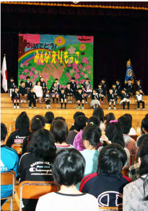
昨年4月のえりも小学校入学式