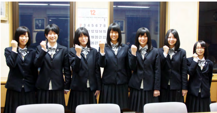
快進撃を続けたえりも高校女子バレー部

同部は一年生一人、三年生六人のチームで、進学や就職活動が控えた三年生は、六月の全道