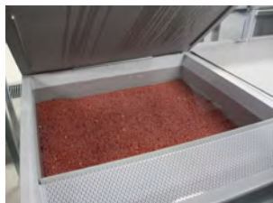
ふ化器「浮上槽」には、サケの卵が収容されています。