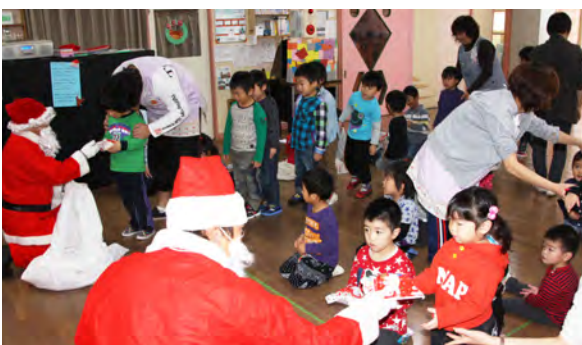
贈り物を受け取る子どもたち

このうち庶野保育所では、サンタが「いい子にしていたかい」と子どもたちに話しかけながら一人一人にプレゼントを手渡し、喜ばれていました。