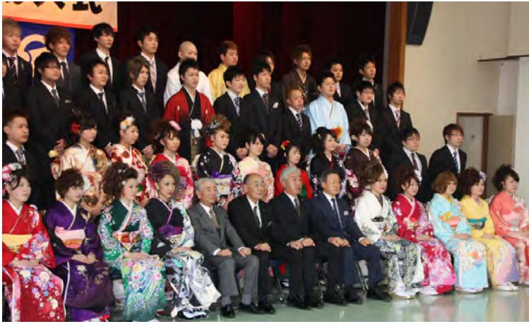
成人式には45人が参加しました。