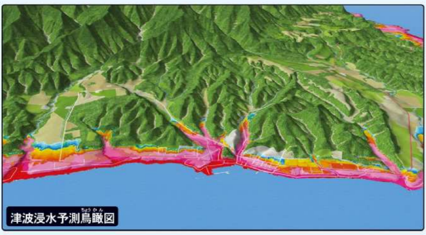
津波浸水予測鳥瞰図